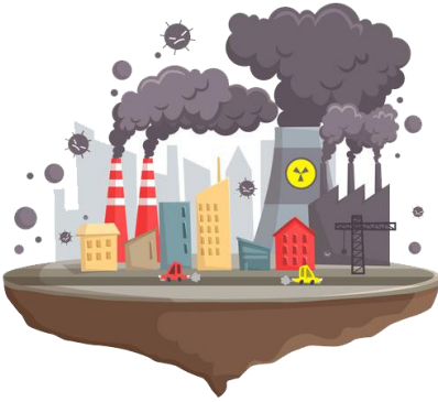
air pollution (hava kirliliği)