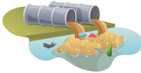
water pollution (su kirliliği)