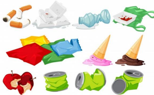
environmental pollution (çevre kirliliği)