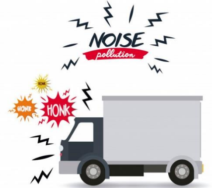
noise pollution (gürültü kirliliği)